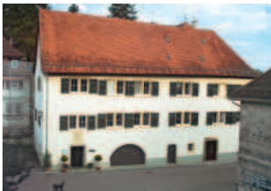
6 Hauptgebäude von Norden.