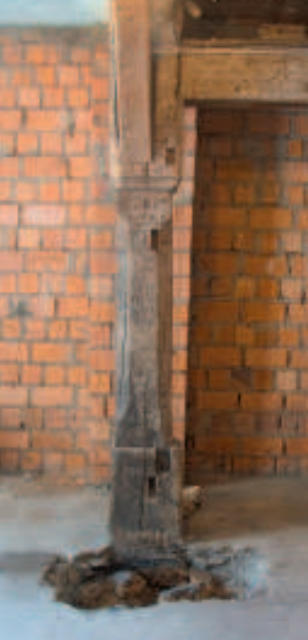
7 Profilierte Eichenstütze und Kopfsteinpflaster im Erdgeschoss.