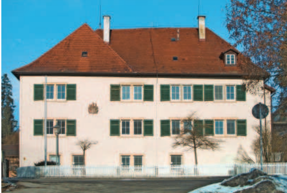
4 Hauptgebäude von Süden.