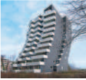
Terrassenwohnhaus in Hemmingen