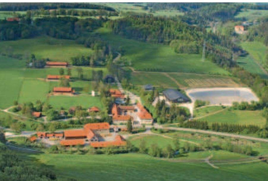
3 Gestütshof Marbach aus der Vogelperspektive.

bunden war. Mit der Gestütsverwaltung, den beiden Stutenherden, der Ausbildungsabteilung für junge Pferde und dem Veranstaltungszentrum bildet er das Herz des Gestüts. Der Gestütshof Offenhausen entstand nach der Säkularisation in den Mauern des ehemaligen Dominikanerinnenklosters Maria Gnadenzell. Der einst als Maultierzucht genutzte Gestütshof an der Lauterquelle ist heute das Zentrum der Marbacher Hengsthaltung. In der ehemaligen Klosterkirche befindet sich das Gestütsmuseum. Auf dem benachbarten Vorwerk Hau werden die Junghengste aufgezogen. Der Gestütshof St. Johann beherbergt einen Großteil der „Schwarzwälder Kaltbluthengste“, die den Fortbestand dieser vom Aussterben bedrohten Kulturpferderasse sichern. Das Vorwerk Schafhaus, in dem noch immer eine Schafprüfstation untergebracht ist, widmet sich der Seniorenpferdehaltung und der Stutfohlen-Aufzucht. Auf dem Vorwerk Fohlenhof wachsen weitere Gruppen von Jungpferden direkt am Albtrauf auf. Die so genannte Fohlensteige führt an den Gütersteiner Wasserfällen und historischen Installationen zur Wasserversorgung auf der Albhochfläche vorbei ins Tal bei Bad Urach zum Vorwerk Güterstein, das aus dem Wirtschaftshof des gleichnamigen Klosters hervorgegangen ist.