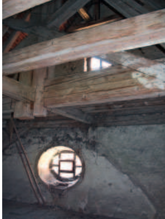
8 Anschluss des ehemaligen Tonnengewölbes und abgesägtes Hängewerk im Dachgeschoss.