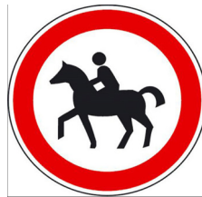
StVO Zeichen 257-51 (bisher Zeichen 258) Verbot für Reiter

Die Anfrage der Deutschen Reiterlichen Vereinigung (FN), Abteilung Vereine, Umwelt, Breitensport, Betriebe zum Zeichen 257-51 an das BMVI wurde vom dortigen Bürgerservice wie folgt beantwortet: